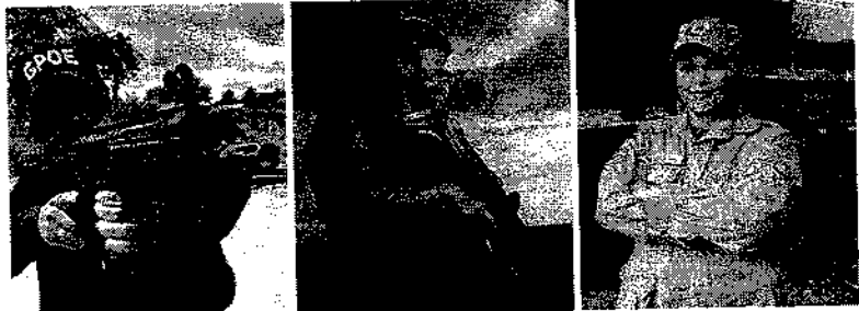
Valentes defensoras: mulheres se destacam na segurança pública e assumem cargos na linha de combate e de comando na defesa do bem-estar social. Página 5

Ancestralidade, defesa social, influência no cotidiano. Paraibanas assumem postos de destaque e tomam para si, cada vez mais, espaços que são seus, por direito de igualdade entre gêneros