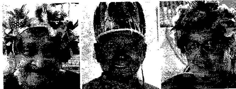
Líderes em sua essência: matriarcas potiguaras são responsáveis pela educação, organização das tribos e preservação da cultura indígena. Página 17