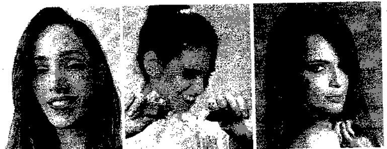
Moças de ser e de fazer: paraibanas influenciam positivamente e atraem a audiência de milhares de seguidores nas mídias sociais digitais. Páginas 18 e 19