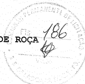
QUADRO COMPARATIVO DOS PREÇOS APRESENTADOS - MAPA DE APURAÇÃO - PREGÃO PRESENCIAL Nº 00011/2018