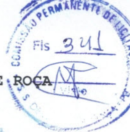
QUADRO COMPARATIVO DOS PREÇOS APRESENTADOS - MAPA DE APURAÇÃO - PREGÃO PRESENCIAL N° 00012/2018