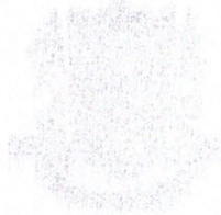
SEVERO LUIS DO NASCIMENTO NETO Prefeito Constitucional

ESTADO DA PARAÍBA PREFEITURA MUNICIPAL DE SÃO SEBASTIÃO DE LAGOA DE ROÇA GABINETE DO PREFEITO